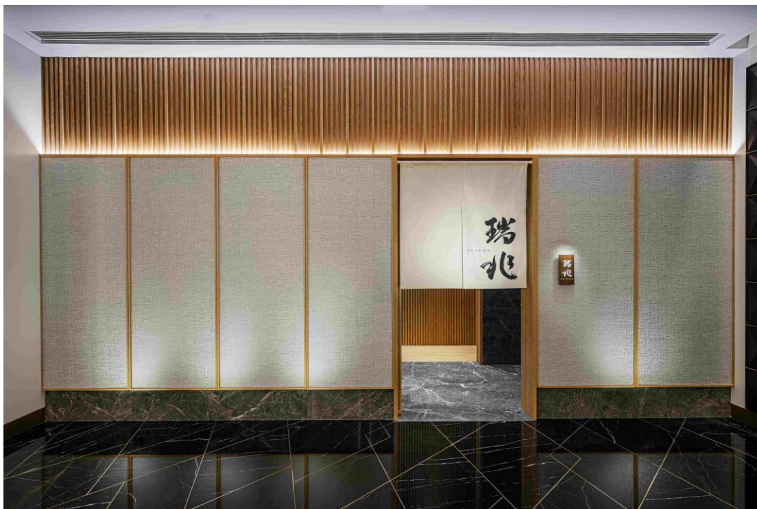
瑞兆慶祝連續第二年獲得《福布斯旅遊指南》五星餐廳評級。