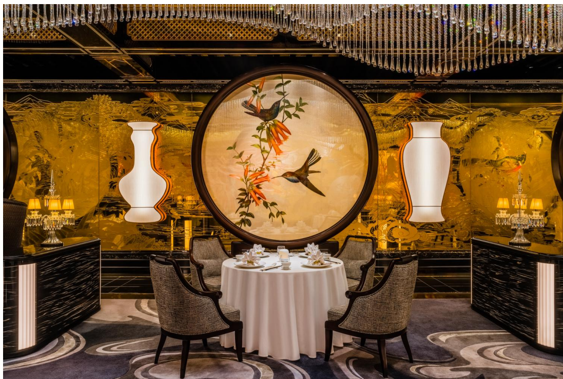
御花園連續第四年獲頒《福布斯旅遊指南》五星殊榮。