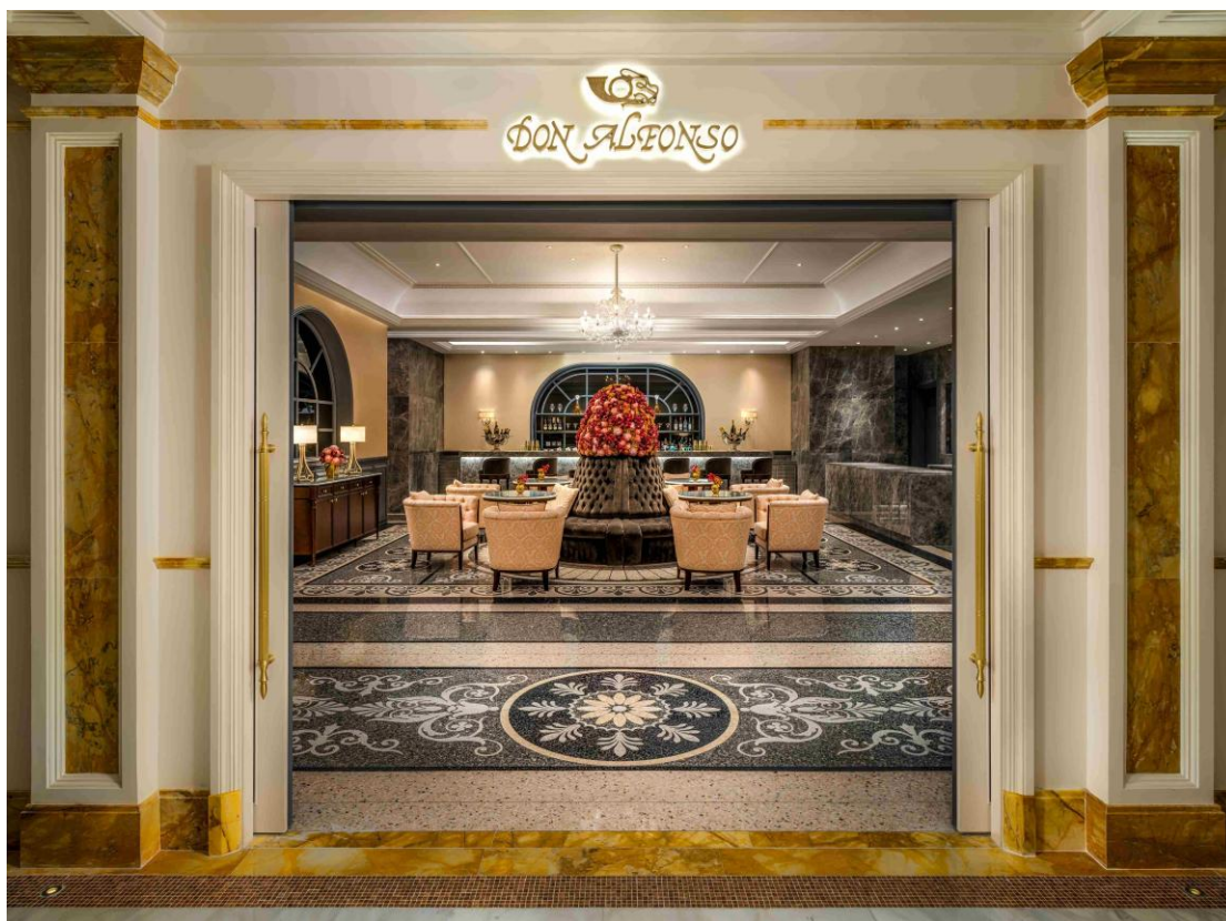
當奧豐素 1890 慶祝連續第二年獲得《福布斯旅遊指南》五星餐廳評級。