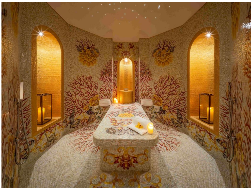
Palazzo Versace 澳門水療中心與上葡京水療中心及 THE KARL LAGERFELD 水療中心再度榮膺五星殊榮，奠定澳門上葡京綜合度假村作為全球擁有最多《福布斯旅遊指南》五星級水療設施的領先地位。