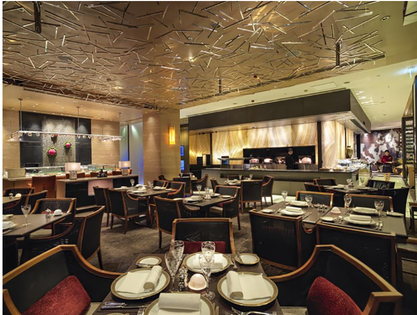
大廚餐廳環境圖片