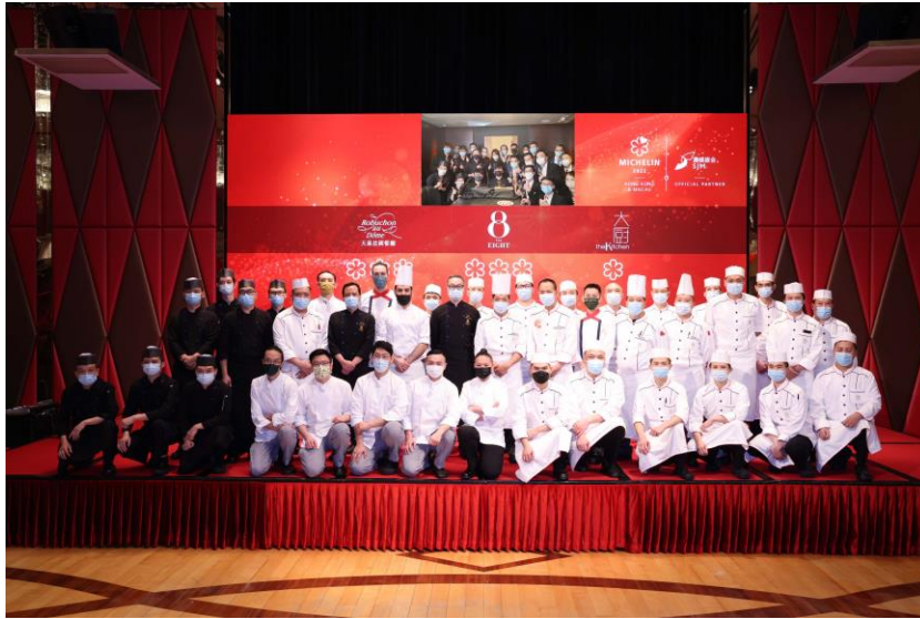
天巢法國餐廳、8 餐廳及 L'Atelier de Joël Robuchon 持續 榮獲《香港澳門米芝蓮指南 2022》頒發米芝蓮三星榮譽， 大廚再度榮獲一星殊榮