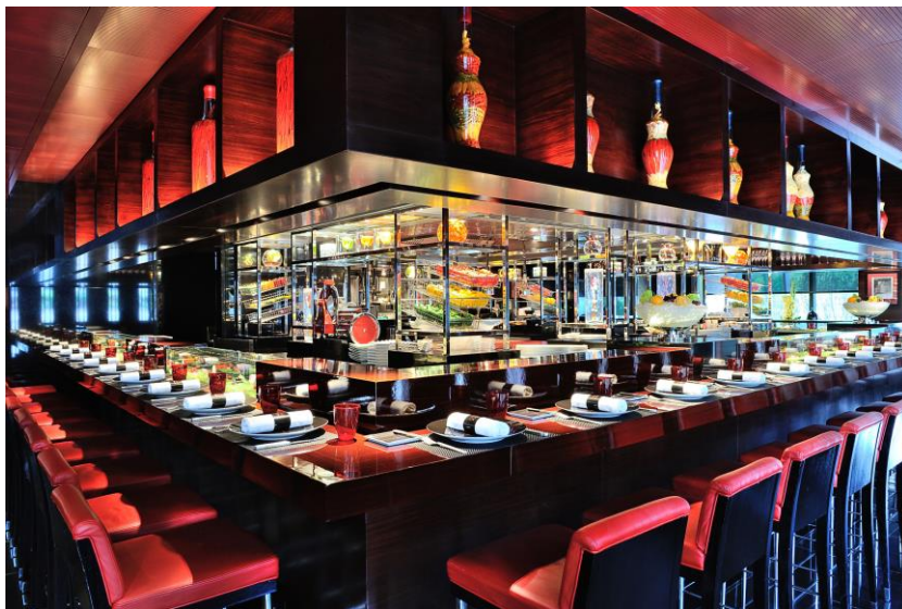
L'Atelier de Joël Robuchon 環境圖片