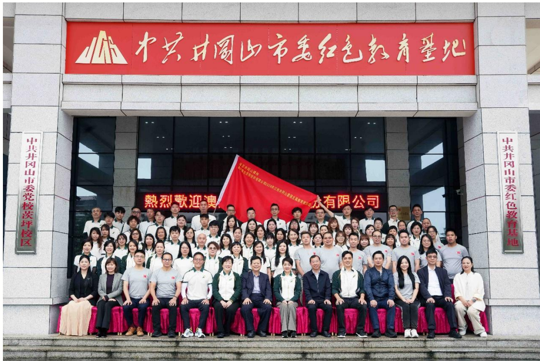
第十屆「江西井岡山愛國主義教育培訓課程」開班儀式在中共井岡山市委紅色教育基地舉行。