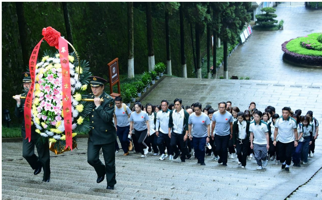
在莊嚴的井岡山革命烈士陵園，學員肅立敬獻花圈，深切緬懷革命先烈英魂。